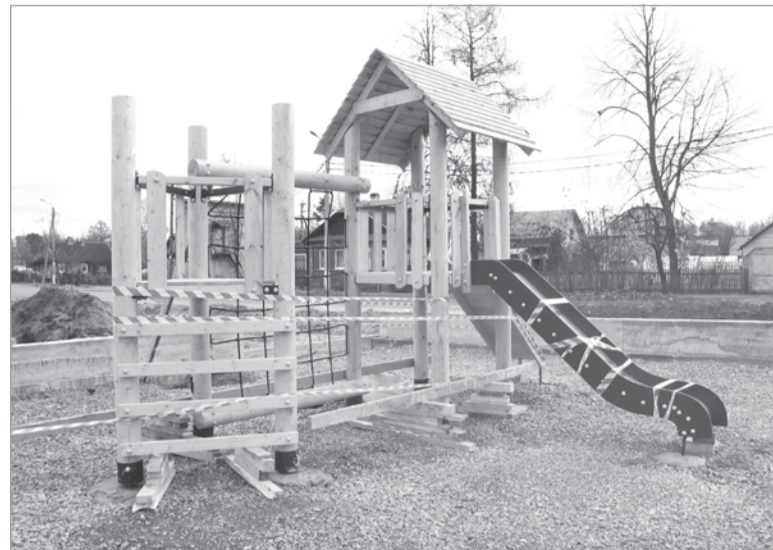
Строители заканчивают оборудование большой детской площадки, где игровые объекты будут из дерева