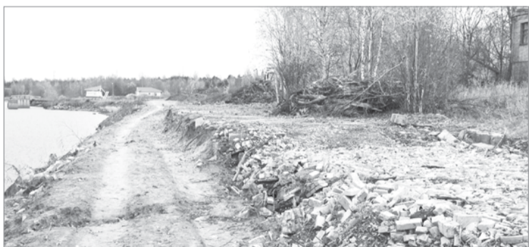
Здесь экотропа будет на щебёночном основании