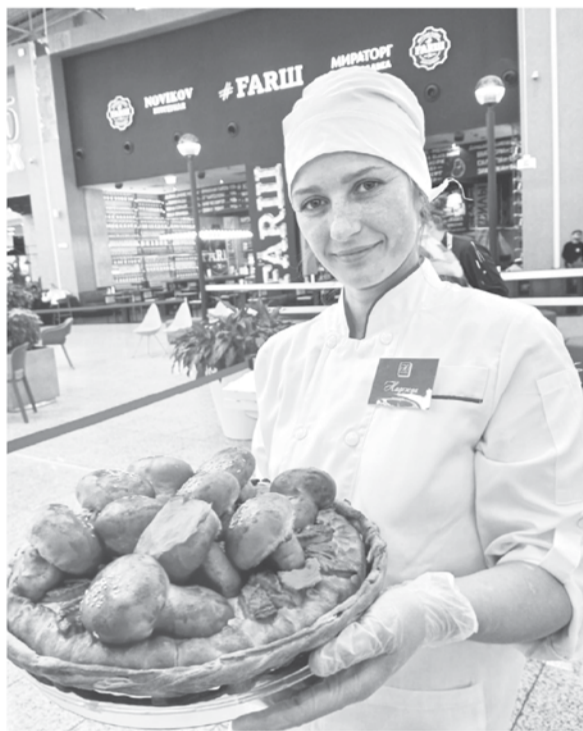
Все блюда на конкурсе были приготовлены из продуктов, выращенных в регионе

Сама Арина осваивает профессию по учебникам и роликам в Интернете. Поддержать таких самородков качествен-