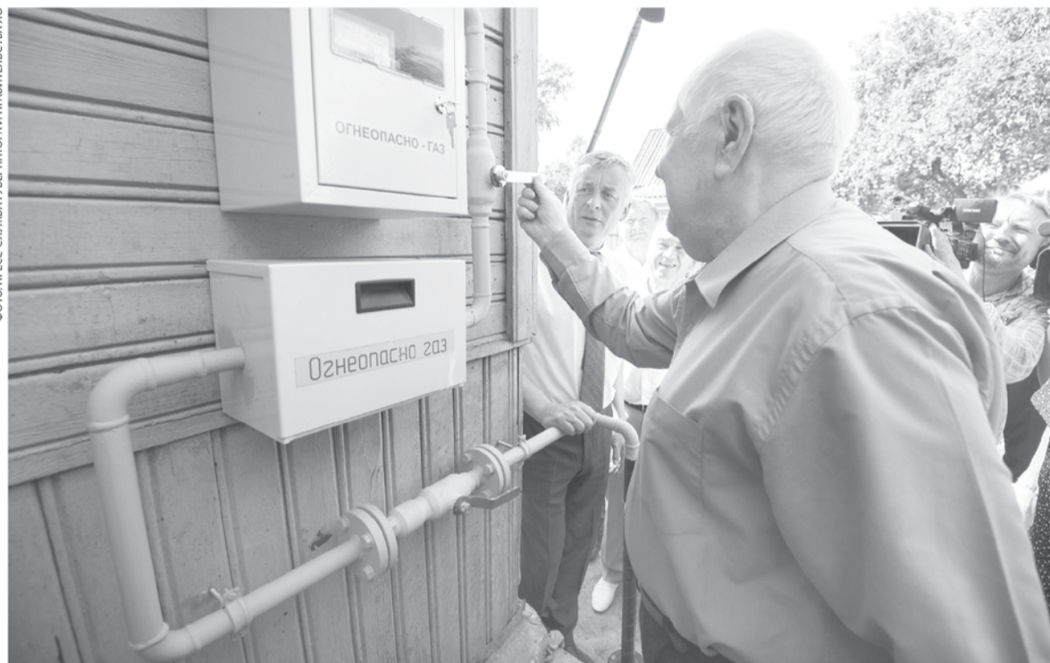
Область субсидирует расходы на проведение работ по догазификации в границах земельного участка

Один из главных энергетических трендов Ленобласти в последние годы – программа догазификации домовладений. Это бесплатное подведение газа к земельным участкам за счёт ПАО «Газпром». Людям остаётся