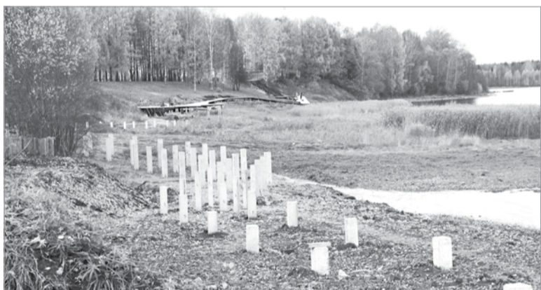
В этом месте береговую территорию отсыпали песком