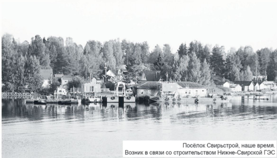
Посёлок Свирыстрой, наше время. Возник в связи со строительством Нижне-Свириской ГЭС

тре Тосненского района – посёлке Новое Тосно – электростанция появилась только в 1936 году, тогда свет получило 320 квартир, железнодорожная станция и некоторые улицы. К началу Великой Отечественной войны из 1 185 жилых домов райцентра имели свет лишь 200, а на его улицах горело лишь 46 фонарей. Значительные работы по электрификации района были запланированы на начало 1940-х годов.