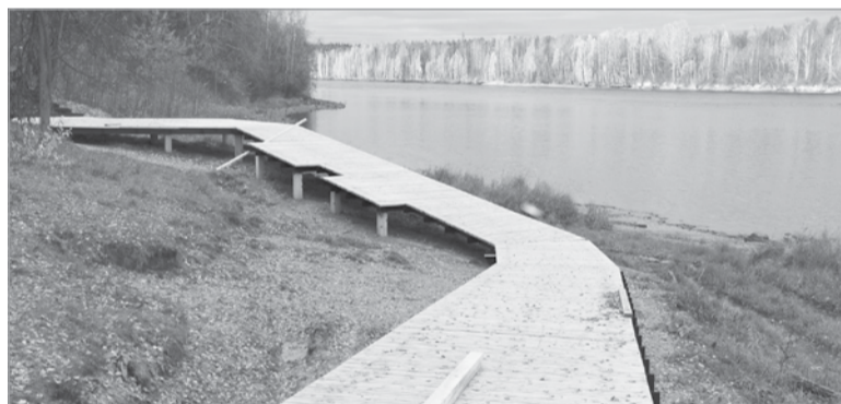
Пешеходный маршрут повторяет природный ландшафт береговой территории