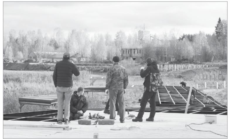
Для настила используют доску сосны