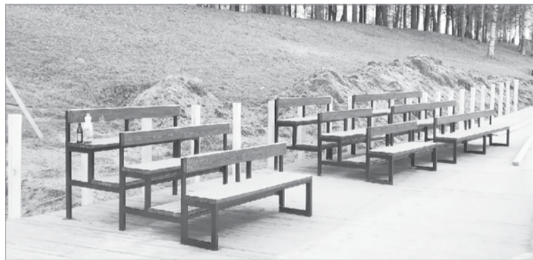
В амфитеатре устанавливают скамейки для зрителей

ходила до самых кустов, после их вырубки прибрежную зону отсыпали песком, привезли его сюда около 1 200 кубометров. Здесь же проложили в земле шесть дренажных труб, чтобы отвести подальше к реке воду от бьющих подземных ручьев.