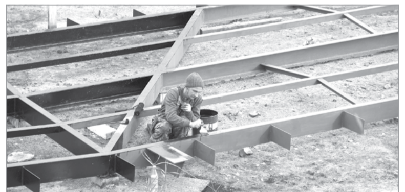
Металлические конструкции грунтуют и красят

Согласно проекту тропа повторяет природный ландшафт береговой территории, она расположена на небольшой высоте от земли. Ширина этого маршрута будет не везде одинаковой, слева от центральной лестницы к Свири на тропе предусмотрены две смотровые площадки для отдыха, где установят скамейки.