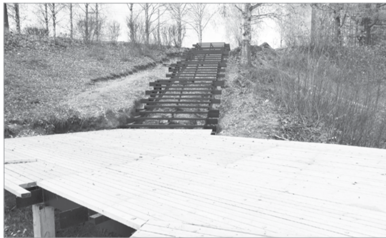
Экотропа начинается от братского захоронения