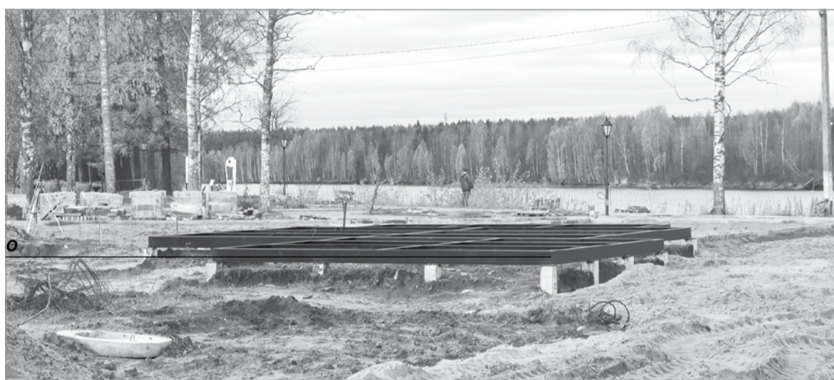
В центре зоны за ДНТ построят торговый павильон