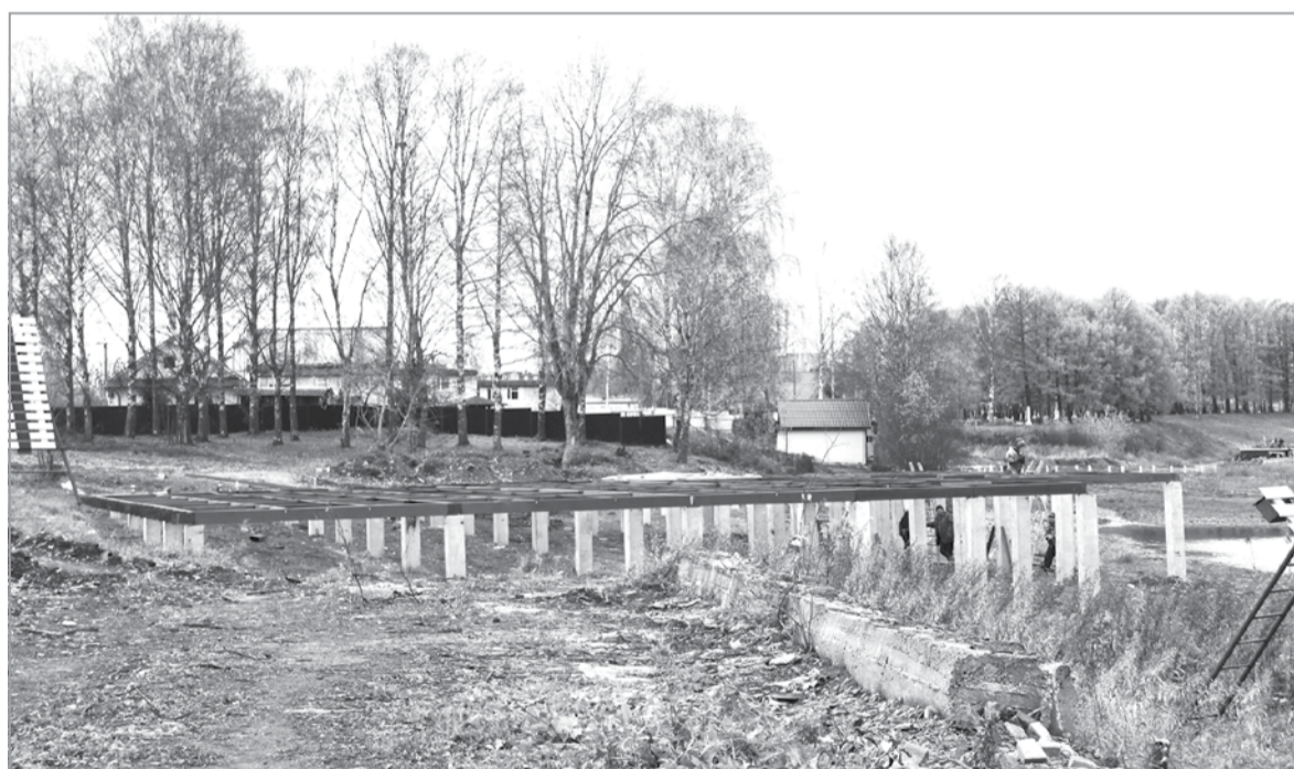
На обзорной площадке установят макет фрегата

этого общественного пространства, где сегодня ведутся работы, является территория за Домом народного творчества имени Ю.П.Захарова, граничащая со сквером Корабелов. Здесь подрядчик также проводил земляные работы, выкорчевывал деревья, снимал часть грунта. Сейчас прокладывает пешеходные дорожки из тротуарной плитки, заканчивает строительство и оборудование большой детской площадки. В центре этой территории вскоре начнется строительство деревянного торгового павильона, где будут сувенирная лавка и небольшая точка общепита. Здание будет похоже по стилю на расположенный по-