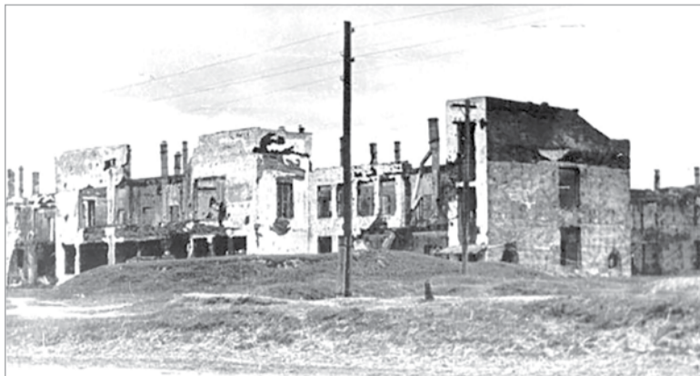
Разрушенное здание городской больницы