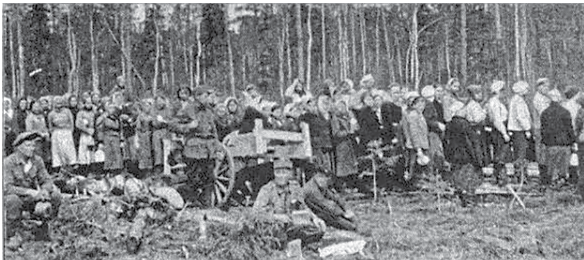
Женщины, содержащиеся в финском лагере № 1, постоянно привлекались к тяжёлым работам на лесозаготовках (Медгора, 1942 – 1943 годы).

Финские оккупанты по примеру своих немецких «учителей» осу-