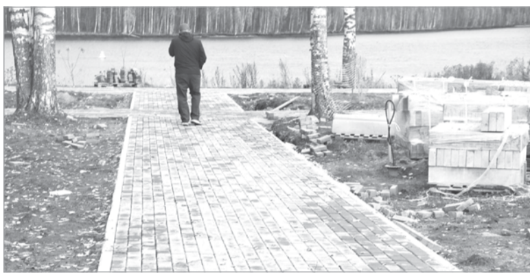
Обустраивается пешеходная дорожка